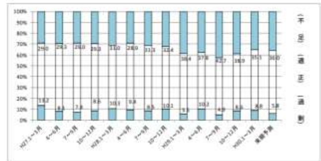
第4図 雇用の状況の推移（全体）

今期において、雇用している人員が 「過剰」と回答した事業所は0.2ポイント増加し、 「不足」と回答した事業所は3.8ポイント減少した。 未来予測に関しては、 飲食業 において「過剰」の割合は増加し 建設・土木業 その他 においては 「人手不足」の傾向が強まると予測されている。